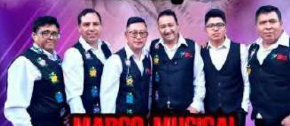
MARCO MUSICAL PERU TAKI