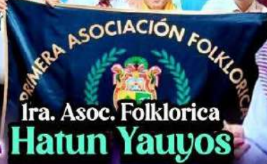
Ira. Asoc. Folklorica Hatun Yauyos