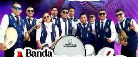
Banda Armonia Corazon

PLATOS TÍPICOS PARA DEGUSTAR LUGAR: RAICES HOUSE CALLE MIÑO 3 AJALVIR POLIGONO INDUSTRIAL CONMAR